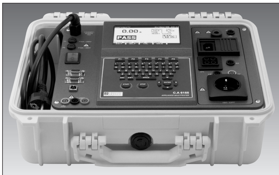
Detail multitester C.A 6155