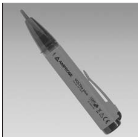
VP-450-E (VOLTfix plus)