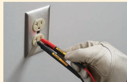
Prodloužení měření v kategorii CAT II.