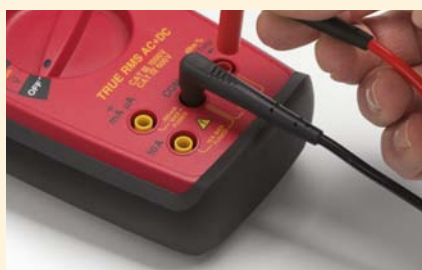
Univerzální konektory jsou kompatibilní se všemi přístroji pro standardní 4mm kryté vstupy.