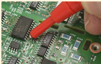
Omezení délky vystavení hrotu a přesné umístění.