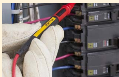
Omezení délky vystavení hrotu pro měření v kategorii CAT III.