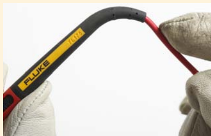
Mimořádně odolný profil v ohybu kabelů testovaný více než 30 000 ohyby.