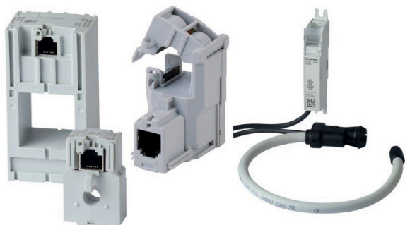
Obr. 5 Proudové senzory TE, TR, TF

Pro sběr naměřených dat lze použít dvě varianty. První možnost je s okamžitým čtením dat na displeji s označením D-70 , který dále umožňuje přímou komunikaci na síť Ethernet nebo RS485, s rozhraním webview nebo bez zobrazení naměřených dat pomocí modulu C30 , který data sesbírá a dále je posílá pomocí komunikace RS485. Modul s označením U3x – tedy modul pro měření napětí přenáší naměřené data dále do sběrnice C30 nebo D50.