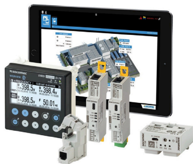
Obr. 6 Diris Digiware

Pro měření zbylých veličin přidáváme proudový modul s označením I-xx , přičemž samotné měření probíhá opět pomocí proudových senzorů, kde samotný modul může měřit 1x3fázově, nebo 3x1 fázově, tato měření se můžou ovšem kombinovat a celkový počet proudových modulů může být 31 tedy až 93 měřitelných vývodů