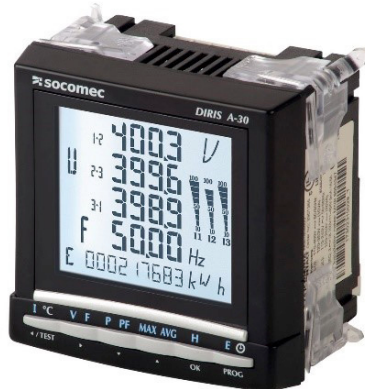
Obr. 1 Diris A30

Další z přístrojů z rodiny Socomec nese označení Diris A40 (Obrázek 2). Tak jak je z názvu známo, jedná se o novější zařízení jako více zmiňovaný Diris A30. Jde o zcela nové zařízení a o nový způsob měření