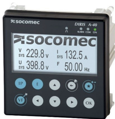
Obr. 2 Diris A40