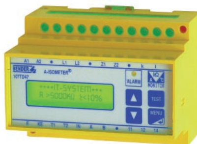
107TD47 Monitor izolace

tak IT síť před přetížením. Současně také monitoruje připojení k monitorované síti a ochranného vodiče.