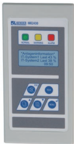
MK2430 signalizační panel

Můžete nás také navštívit na 15. MSV v Nitře v Pavilonu F, stánek č. 58, který se koná ve dnech od 19. 5. do 23. 5. 2008