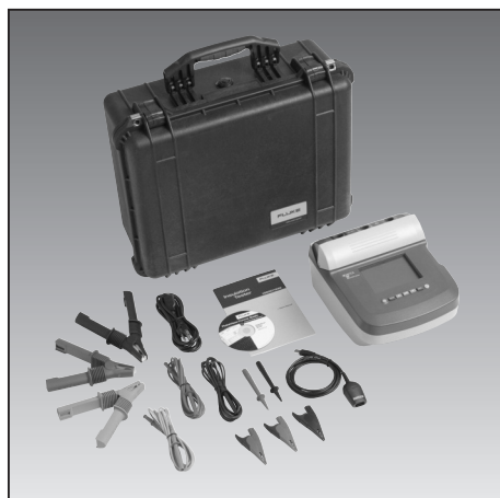
Příslušenství verze /KIT